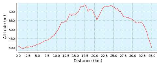
Höhenprofil (396 m bis 638 m)